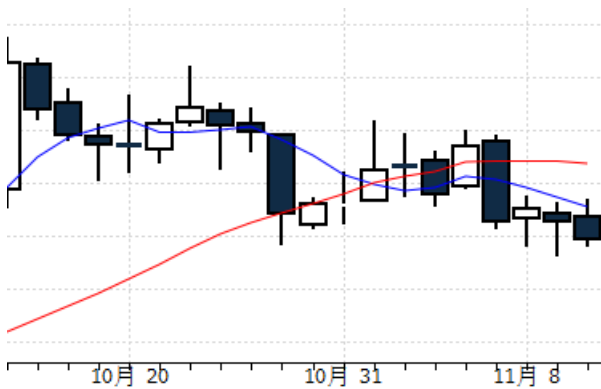
图表 9:LME 三月铜远期