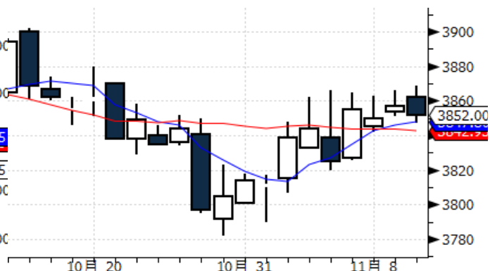
图表 4:上海黄金交易所 AG(T+D)