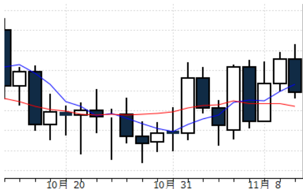
图表 5:国际铂金现货