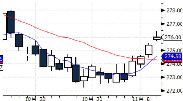
图表 2:上海黄金交易所 AU(T+D)