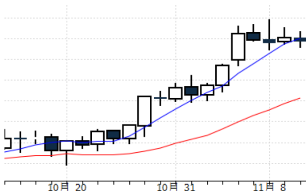
图表 7:WTI 原油期货