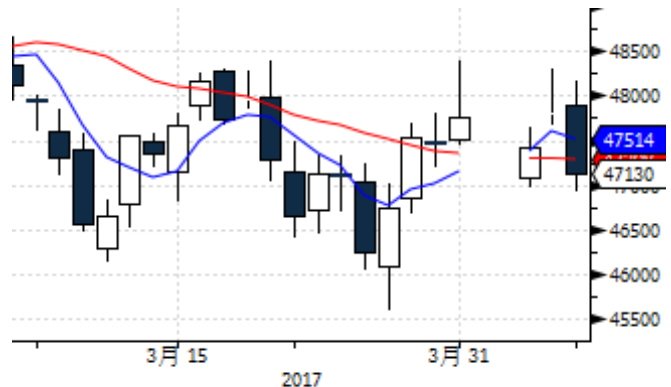
图表 10: 上期所沪铜期货