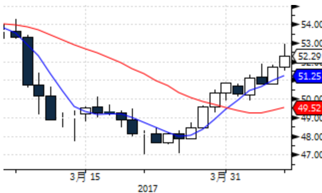
图表 7: WTI 原油期货