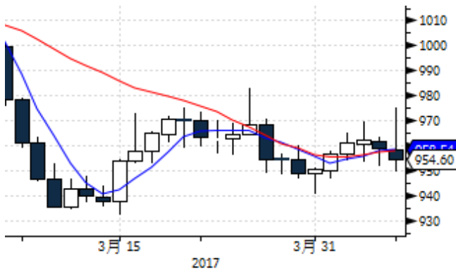
图表 5: 国际铂金现货