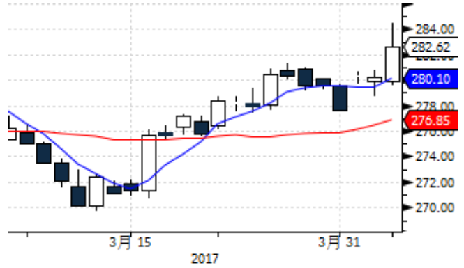
图表 2: 上海黄金交易所 AU(T+D)