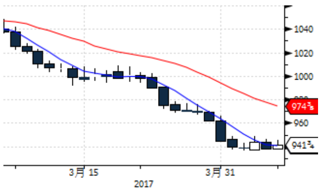
图表 11: CBOT 大豆期货