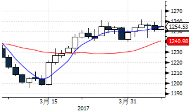
图表 1: 国际黄金现货