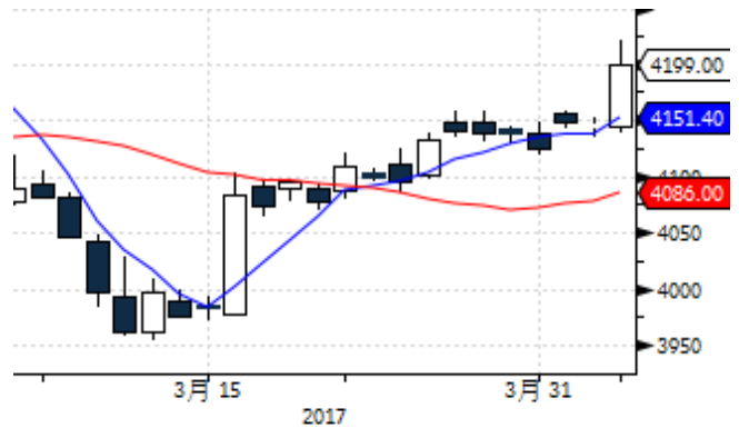
图表 4: 上海黄金交易所 AG(T+D)