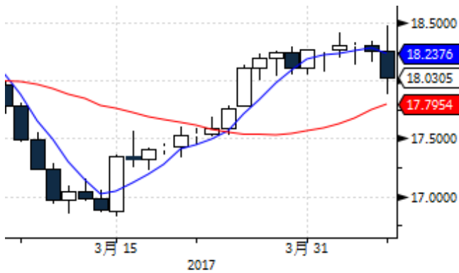
图表 3: 国际白银现货