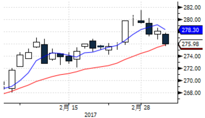
图表 2: 上海黄金交易所 AU(T+D)