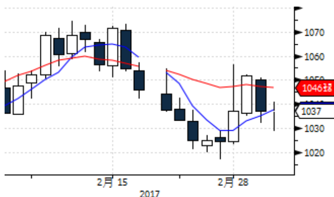
图表 11: CBOT 大豆期货