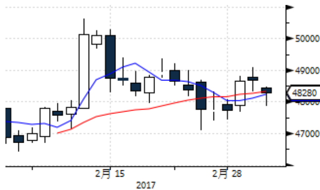
图表 10: 上期所沪铜期货