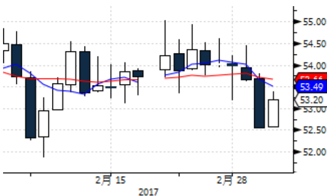
图表 7: WTI 原油期货