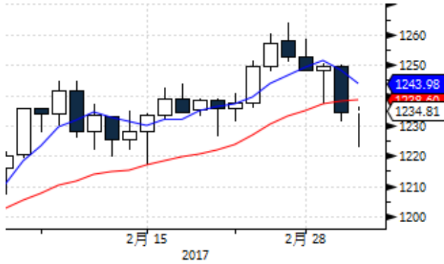
图表 1: 国际黄金现货