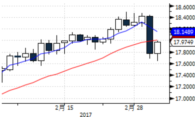
图表 3: 国际白银现货