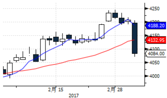
图表 4: 上海黄金交易所 AG(T+D)