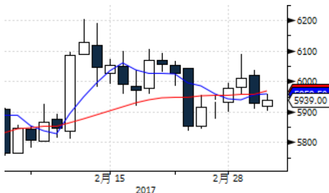
图表 9: LME 三月铜远期