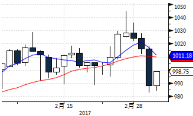
图表 5: 国际铂金现货