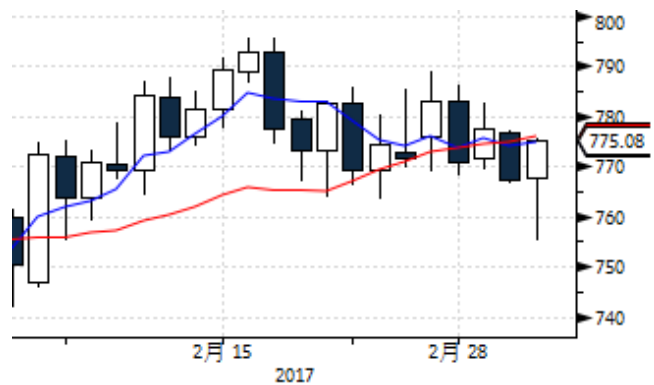
图表 6: 国际钯金现货