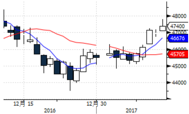
图表 10: 上期所沪铜期货