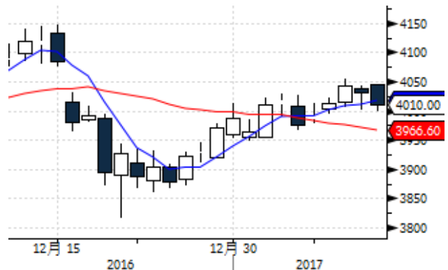
图表 4: 上海黄金交易所 AG(T+D)