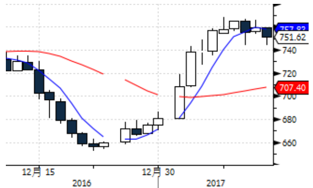
图表 6: 国际钯金现货