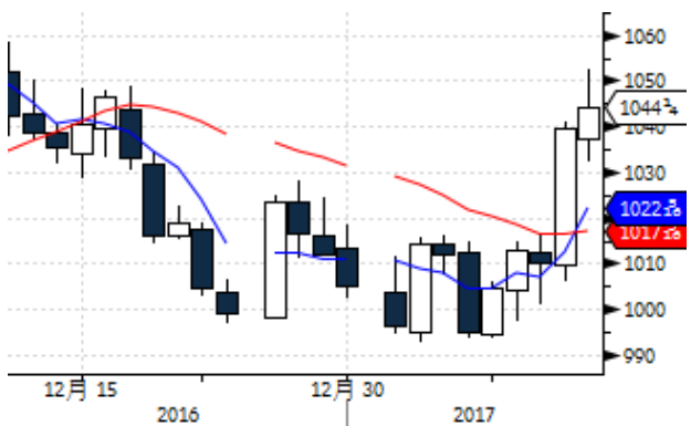
图表 11: CBOT 大豆期货