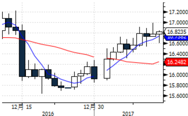
图表 3: 国际白银现货