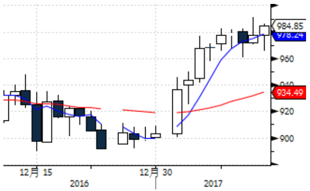
图表 5: 国际铂金现货