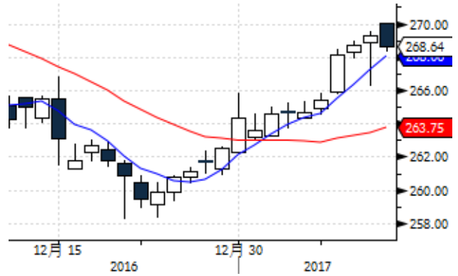
图表 2: 上海黄金交易所 AU(T+D)