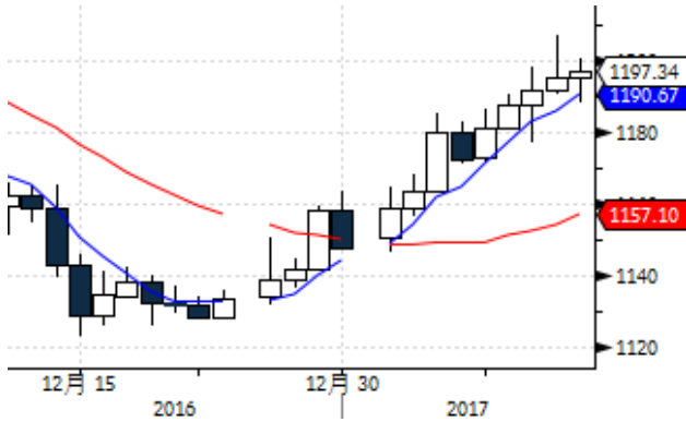
图表 1: 国际黄金现货