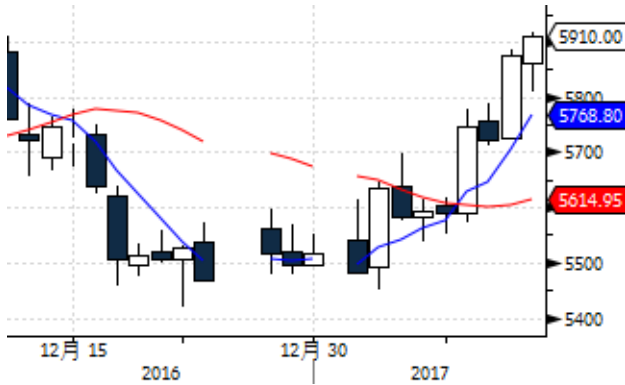
图表 9: LME 三月铜远期